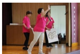
♪じゃんけんで皆さん大盛り上がり♪