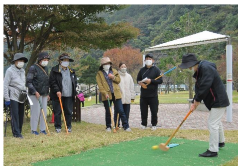
職員合同支所活動（久山グラウンドゴルフ）