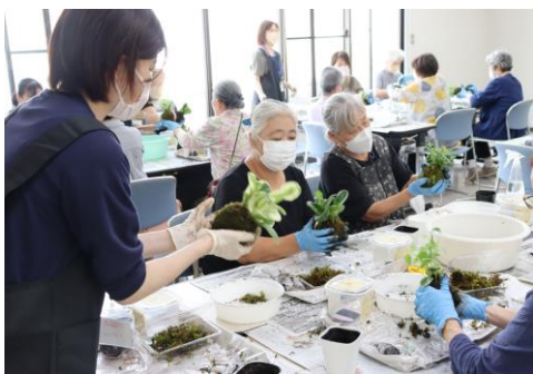
支所活動（須恵苔玉作り）

11月のふれあいの旅は、「秋の久住高原日帰り旅行」に行き、美味しい食事や九重夢大吊橋九酔溪峡の紅葉を満喫しました。3年ぶりの旅行で皆さまにとっても喜ばれました。