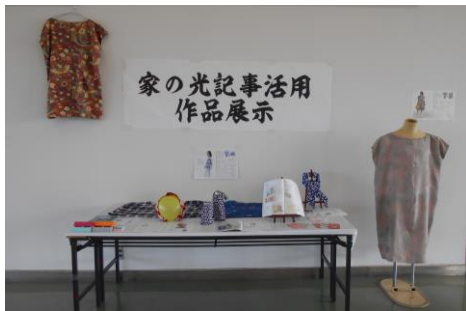
家の光記事活用作品展示 (9月14日)

「JA福岡県女性協議会創立70周年記念大会」において、県下女性組織で「おもいやり」の歌の手話リレーをしました。