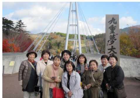
ふれあいの旅（11月11. 14. 15日）