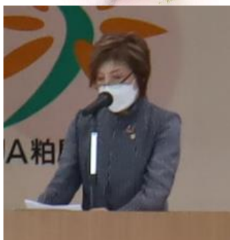
あいさつをする鬼塚部長