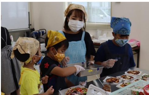
親子食育教室「ピザ作り」（8月20日）