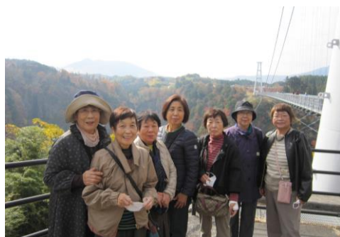
ふれあいの旅（11月11. 14. 15日）