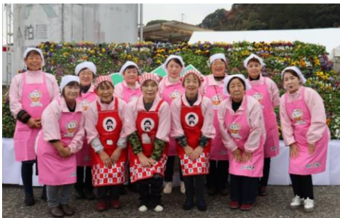
第36回粕屋農業まつり（12月4日）

また、食の安全・安心「地産地消」を呼びかけながら、年2回親子食育教室に取り組みました。8月に米粉や粕屋産野菜、手作りトマトケチャップを使った「ピザ作り」、1月にはエコープむしパンミックスを使った「どら焼き作り」を実施し、延べ35名の参加があり大盛況でした。