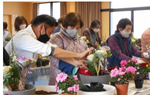
お正月ガーデニング教室（12月7.8.9日）