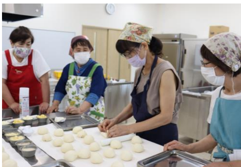
本所サークル（パン・お菓子教室）