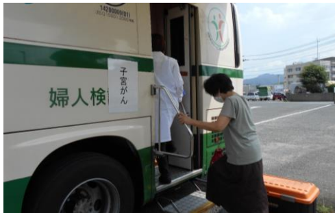
乳ガン・子宮ガン検診（7月21.22日）

健康大会は、例年駕与丁公園のウォーキングを行っていましたが、新たな試みとして軽スポーツに取り組みました。東京パラリンピックで広く認知されたボッチャをはじめ、輪投げやスカットボールに挑戦し、とても盛況で笑顔の絶えない大会となりました。