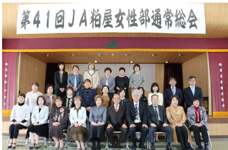
令和4年・令和5年度三役・支所部長