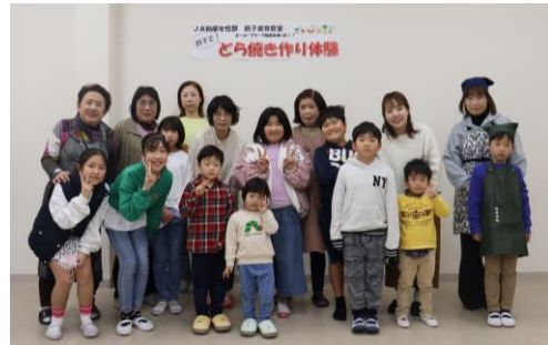
親子食育教室「どら焼き作り」（1月21日）