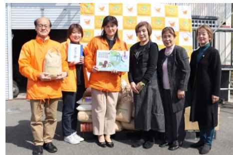
フードドライブ実施 (2月13～15日)