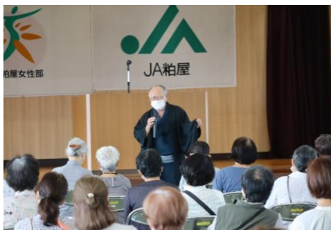
第33回家の光愛読者大会（9月14日）