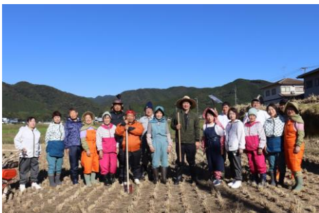
青年部合同活動 (山田小稲刈り10月20日)