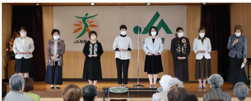
退任のあいさつをされる鬼塚部長