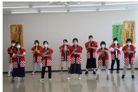
「おもいやり」の歌 手話リレー