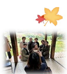
レストラン和顔馳