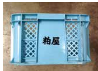
水色に【粕屋】の文字