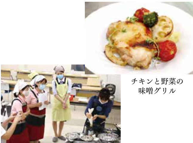
チキンと野菜の 味噌グリル