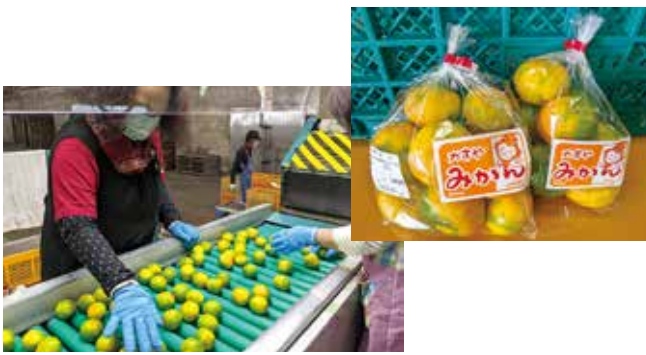
早味かんを選果する作業員

早味かんの選果が始まりました。早味かんは極早生みかんで福岡県内に限り栽培されており、一定程度の基準を満たしたものが「早味かん」として販売される。緑色と橙色の彩りが美しいのが特徴。今年 は長雨や台風などの天候が続きましたが、生産者の高品質対策の徹底により昨年以上の果実品質となつています。管内で採れた早味かんは直売所等で購入することができます。