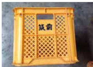
黄色に【筑前】の文字