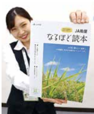
組合員外向け広報誌「JA粕屋なるほど読本」

組合員外に向けた広報誌「JA粕屋なるほど読本」を発行しました。組合員加入促進が目的です。 ガイドブックには協同組合の役割、正・准組合員の説明、組合員や地域の皆さまへのサービス、当JAが行っているイベントや活動、管内農産物の紹介。JAを利用したことのない人にもわかりやすく説明しています。JAが自己改革でも掲げている組合員加入増進に繋がるのではないかと期待を寄せています。 発行した「JA粕屋なるほど読本」はお近くの支所またはプラザで読むことができます。