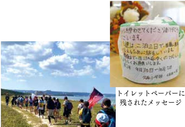
遺跡・史跡巡りの旅

久山町立久原小学校の児童らが、「遺跡・史跡巡りの旅」の途中で当JAに休憩に立ち寄った際「トイレを使わせてくださりありがとうございました。」と書いています。私たちは、二泊三日で、首羅山遺跡を伝えるために旅をしています。最後まで一生けんめいに歩くので応援よろしくお願ひします。令和2年9月30日、10月2日久原小学校6年生一同」と書いたメッセージがトイレトペーパーに張り付けられさりげなく残されていました。気が付いた職員は思わずほっこり。児童らが無事旅を終えることを願ひました。同小学校の6年生は、久山町の誇りである「首羅山」を伝えるために毎年徒歩で「遺跡・史跡巡りの旅」を行っています。