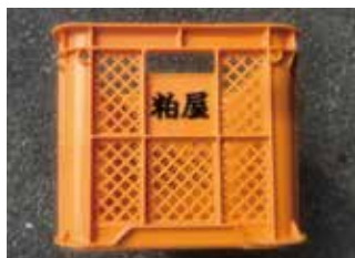
黄色に【粕屋】の文字