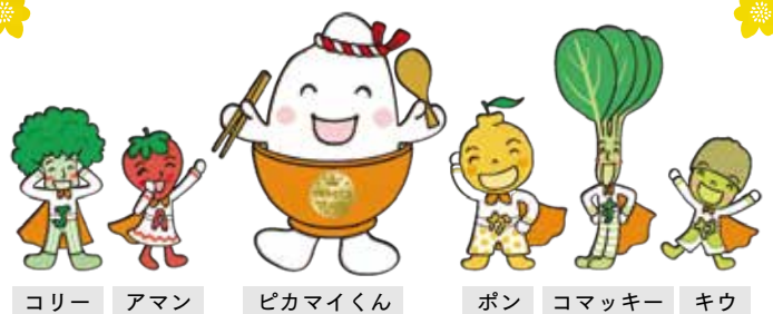
コリー アマン ピカマイくん ポン コマッキー キウ