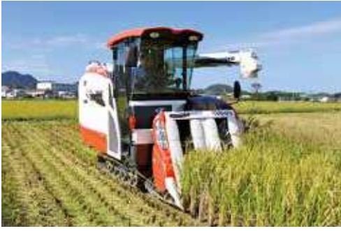
「元気つくし」稲刈りの様子

管内の元気つくしの作付面積は138ヘクタール、23年度は1,080トンの集荷を見込んでいます。