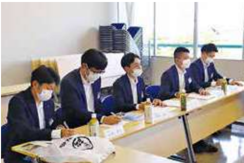
研修会開講式で熱心にメモを取る共済連職員

今回の研修の目的はJ A事業の業務体験を通して、J A系統の一員としての自覚と一体感を図ることが目的です。今回の研修参加者は「日頃の業務では共済事務が中心であり、経験することができない事を支所での推進業務やプラザでの営農・経済に関する業務を通して学ぶ事が出来た。今回の現地研修会で経験したことをこれからの業務に活かしたい」と話していました。