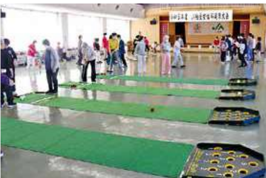
軽スポーツを楽しむ女性部員

JA粕屋女性部は本所3階ホールで令和5年度女性部健康大会を開き、部員76名が参加しました。 本年度は血管年齢・骨密度測定や輪投げ、スカットボールなどの軽スポーツを行い、さらなる健康づくりとして部員間の交流を深めました。