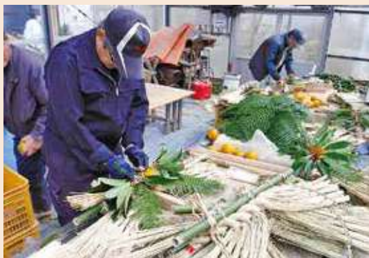
しめ縄制作の様子

そこで「実とらず」という品種の種を新潟県から取り寄せることにし、栽培を始めました。しめ縄用のワラの収穫は8月頃です。穂が出てくる前の、稲がまだ青い間に刈り取りを行います。そうしないと青々とした色のしめ縄にならないからです。その後干して乾燥させようやく製作の開始です。製作は10月末から12月末まで屋外で行い、小雪舞う寒い日でも休みはありません。連日の作業でワラを扱う会員の手は冷たく、脂分も取られ、指紋がなくなるほどです。