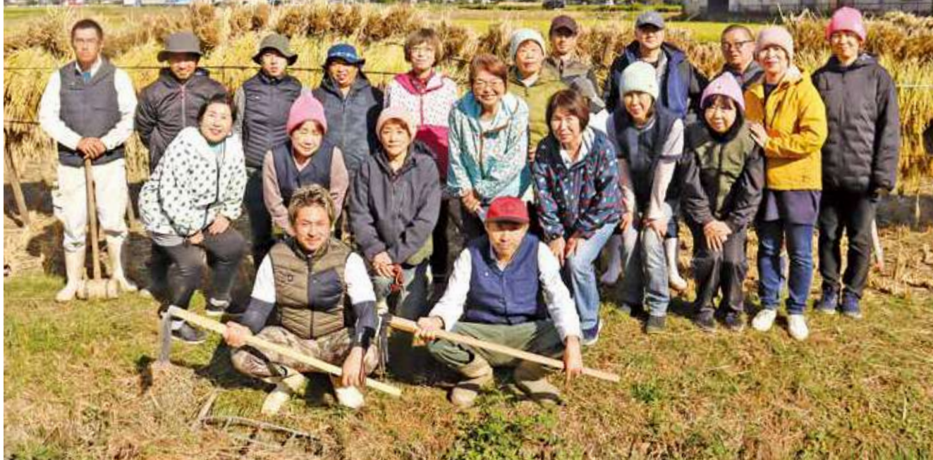
女性部・青年部役員のみなさん

JA粕屋女性部・青年部合同活動：令和5年10月20日 『山田小学校(久山町)稲刈り作業体験に参加しました』