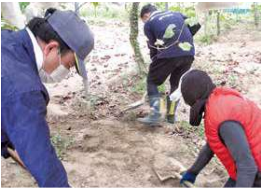
土砂の撤去作業を行う職員