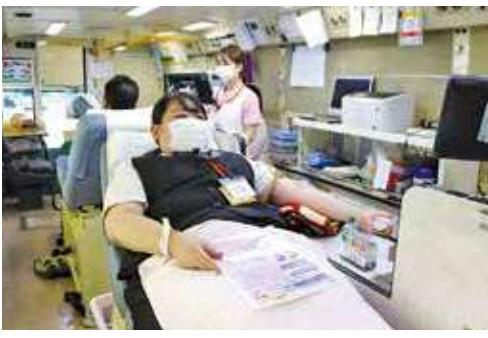
献血を行う本所職員

輸血に必要な血液製剤は人工的に造れない上、長期保存もできません。血液製剤を確保しておくには、継続的な献血が不可欠です。同センターは、献血は命が救える身近なボランティアとして、多くの人に理解と協力を求めています。