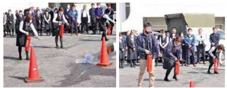
消火器による初期消火訓練を行う本所職員

本所で、火災の迅速かつ適切な通報及び初期消火技術の向上を目的に避難訓練を行いました。当日は火災の発見から通報、初期消火から避難誘導まで一連の避難訓練を展開しました。参加した職員は「実践的な避難活動をしたことで、1分1秒の大切さが分かった。この経験を活かし、火災や災害が発生した時は迅速かつ適切に行動したい」と話しました。