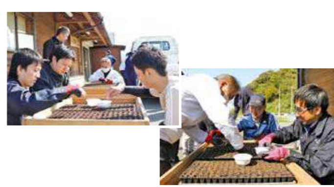
スイートコーンの播種作業を行う本所職員

「粕屋満喫CLUB」のスタートとして営農経済部・企画管理部・金融共済部・総務部より18名が参加して、スイートコーンの播種作業を行いました。今回播種したスイートコーンは6月下旬から7月初旬にかけて収穫を行い、金融店舗での貯金、ローンキャンペーンでの成約者プレゼントとして計画しています。参加した職員は、「今回播種した農産物が有効活用されることで、少しでも農業に興味を持って頂き、新規就農者支援の活性化へと繋げていきたい」と話しました。