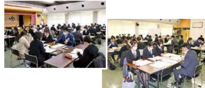
次年度に向け研修に参加する職員

金融共済担当職員を対象に「支所長・金融課長・事務リーダー合同事務研修会」を本所で行いました。貯金課より次年度へ向けての「営業店システム移行について、令和6年度事務管理態勢の定着・深化の取組みについて、国庫年金振込の事務堅確性向上にかかる取組みについて」等の説明を行いました。参加した職員は、「今回の研修を活かして次年度へ向けしっかりと準備をしていきたい」と話しました。