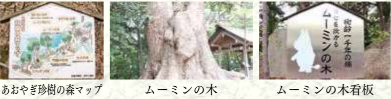
あおやぎ珍樹の森マップ ムーミンの木 ムーミンの木看板