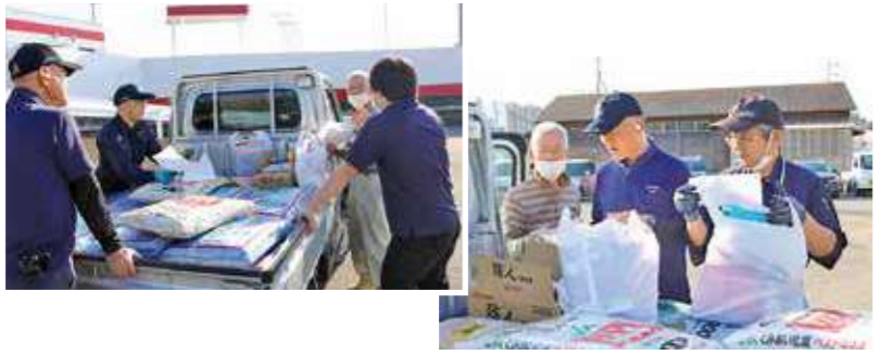
水稻肥料の積み込み、農薬の検品を行うプラザ職員

南・中・北部の各プラザは4月13日・14日の土・日曜日、各プラザや農業倉庫、カントリーエレベーター等で水稻予約肥料・農薬等直取りを行いました。早朝より、注文した肥料と農薬を受け取り、組合員の皆さんが次々と訪れ、職員は積み込み作業に追われました。組合員は「重い肥料をトラックに運び込んでくれるのはとても助かる」と話しました。