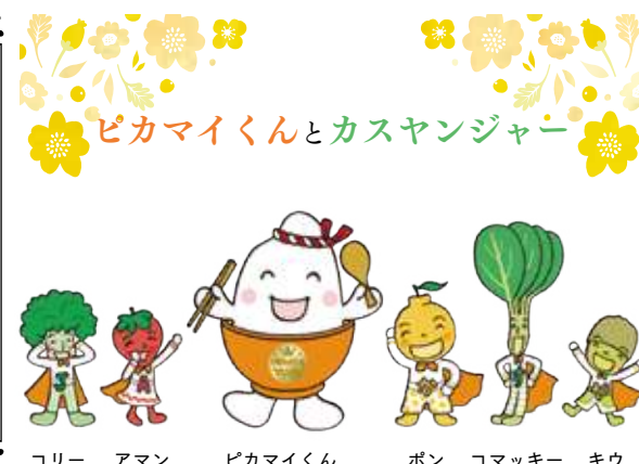
コリー アマン ピカマイくん ポン コマッキー キウ

満開だった桜も散ってしまい、あっという間に葉桜となりました。 今年のゴールデンウィークはお仕事だった方もいらっしやれば、10連休という方もいらっしやったのではないのでしょうか? 私はカレンダー通りのお休みを頂きましたが、毎年恒例のタケノコ掘りを行ったり、博多となく港祭りに娘が高校ダンス部として出場した為、家族全員で応援に行ったりと充実したお休みとなりました。 連休明けは体調を崩される方もいらっしゃるかと思いますので、十分な睡眠と規則正しい生活、バランスの取れた食生活で乗り切ってくださいね。 また、今年も春の終わりがから気温が高く、早めの熱中症対策が必要だと言われています。 ①暑くなり始めの頃から、暑さに備えて体づくりを行う。 ②できるだけ暑さを避けて、喉が渇く前から水分補給を心がける。 ③暑さを我慢せず、エアコンを使って室内の温度を適度に下げる。 以上の事に気を付けて猛暑を乗り切りましょう。 (N)