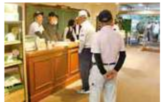
コンペ受付の様子

年金友の会は、久山カンントリー倶楽部で「JA倶楽部ゴルフコンペ」を開き、12組39人が参加し、会員相互の親睦を深めました。参加者は「次回の開催も楽しみにしている」と話していました。成績は次の通りです。