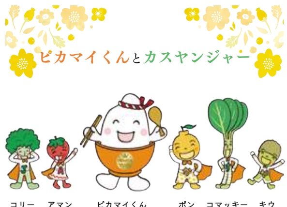
コリー アマン ピカマイくん ポン コマッキー キウ

夏真っ盛りの8月、連日気温35度以上の猛暑日となり、「熱中症」となるリスクも高まってきました。 命にかかわる危険性がある熱中症ですが、速やかに適切な応急処置を行うことで、重症化を防ぐことができます。 応急処置で大切な3つのポイント ①クーラーが効いた室内や車内へ移動しましょう。 ②衣服をゆるめて、体の熱を放出しましょう。 ③氷枕や保冷剤で両側の首筋や脇、足の付け根などを冷やしましょう。 ④水分と塩分を同時に補給できる、スポーツドリンクなどを飲ませましょう。 おう吐の症状が出ていたり意識がない場合は、誤って水分が気道に入る危険性があるので、むりやり水分を飲ませることはやめましょう。 救急車を待っているあいだにも、現場で応急処置をすることで症状の悪化を防ぐことができます。 熱中症は命に関わる危険な症状です。甘く判断しないように心がけましょう。(N)