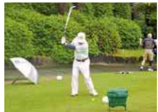
コンペを楽しむ会員