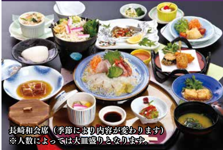
長崎和会席（季節により内容が変わります） ※人数によっては大皿盛りとなります。