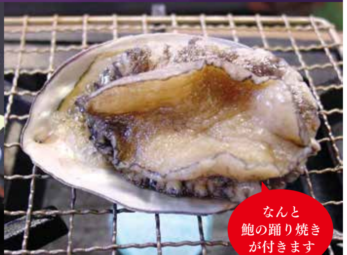
なんと 鮑の踊り焼き が付きます

1泊2食 ◎個人は2名様より ◎8名様以上は基本客室の定員-1名様より（ご相談下さい）