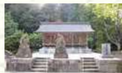
境内神社風景（末社）