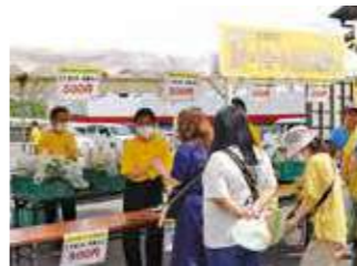
スイートコーン販売を行う本所職員