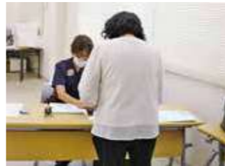
検診受付を行う女性部員