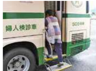
検診車へ乗り込む女性部員

女性部は、がん検診を本所で開催しました。乳腺エコー検診を46人、子宮がん検診を39人が受診しました。経済課生活担当職員は「早期発見・早期治療で健康管理に役立ててほしい」と定期検診の受診を呼び掛けています。