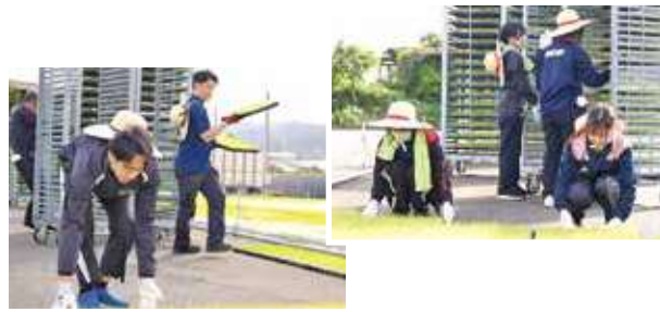
硬化作業を行う新入職員

5/10 新入職員研修で 水稻苗硬化作業 新入職員現地研修会を行い、本年度新入職員10名が北部育苗センターで「夢つくし」の水稻硬化作業を体験しました。 近年の新入職員は家庭が農家以外だったり、農家であっても農業の実験が少なく、なってきているため、この研修を通して農業の基本的な知識を習得し、JA職員として一層の研さんを積んでもらうのが狙いです。 体験を終え、農業の大変さを実感した新入職員は「JA職員として農家さんの力になれるようこれから頑張りたい」と意欲を見せていました。