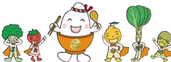
コリー アマン ピカマイくん ボン コマッキー キウ