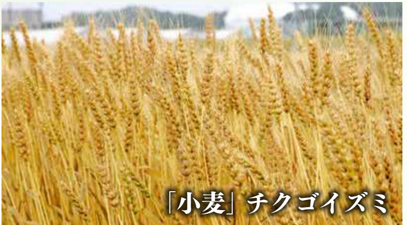
「小麦」チクゴイズミ

パン、ケーキ、うどん、ラーメン、みそ、麦茶、ビール、焼酎などなど：私たちの周りにある食料、飲料の原料には、数多く「麦」が使われています。 麦は、用途に応じて小麦、大麦、はだか麦に分けられますが、福岡県は北海道に次ぐ麦の大生産地です。 チクゴイズミは、1994年に九州沖縄農業研究センターで生まれた品種です。タンパク質含有量が9.5%・10.5%程度（施肥量により異なる）で中力粉に分類される小麦です。 また、コムギの品種のひとつ、「関東107号」と「アサカゼコムギ」の交配により九州農業試験場が育成を行い、北九州地域など、温暖地以西の平坦地での栽培に向く品種として開発されました。製めん適性に優れ、農林認定品種となっています。旧系統名は西海171号。 国産小麦の主な用途は、日本麵（うどん、そうめん等）ですが、この中力粉は主に日本麵で使用されています。近年日本麵用として単独挽砕（他の品種と混ぜて製粉しないこと）が増加、うどん等で輸入麦にない独特のモチモチ感が出せる特長があり、九州以外での需要も拡大しています。 チクゴイズミの特徴 1. 早生で収量性に優れる。 2. 千粒重がやや大きく、穂発芽性が難で、枯れ熟れ様障害に強い。 3. 製粉特性は農林61号と同程度で、製めん適性はめんの食感にやや優れる。 4. たんばく質含量が14%と多く、コムギ縮萎縮病に強い。 5. 稈長はやや短く、穂長はやや長い。倒伏の発生は少ない。 6. 60%粉の粗蛋白質含量は高く、灰分含量はやや高い。小麦粉の明るさ、黄色みはほぼ同程度である。