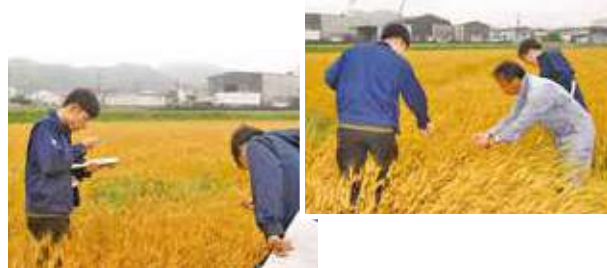
麦の生育状況を確認する普及センター、営農指導員ら

5/12-13 19-20 総代会を前に 地区別座談会を開催 本所・支所・プラザなどの6会場で、総代会事前説明会に代わる地区別座談会を開催し、管内11支所の総代や支所運営委員ら330名が出席しました。 JA役職員が、通常総代会の提出議案である令和6年度事業報告・7年度事業計画等について、地区別座談会資料に沿って説明。合わせて総代を対象に行った「JAに対する意見・要望」について各会場で回答を行いました。 意見交換の場では、出席者から米の価格や生産者所得、農産物販売、農業振興に関する意見が寄せられました。