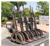
公園入口 モニュメント