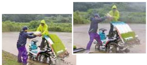
雨の中、田植え機へ苗を積み込む生産者(篠栗町若杉地区)

5/22 小麦収穫 ほ場巡回 小麦ほ場検見会を開き、麦生産農家や農事組合法人代表、北筑前普及指導センター、JA営農指導員ら19名が出席しました。 管内5カ所のほ場を巡回、成熟状況や赤かび病の発生状況を確認した後、カントリエレベーター荷受け日を決しました。 営農販売課の担当者は管内ほ場を巡回し、「赤かび病の発生は見られず、適期収穫を行い、品質を落とさないよう注意してほしい」と呼び掛けました。 管内の麦生産農家は5戸と4組合。 「チクゴイズミ」50・18鈔を作付けし、年間約160トンの収穫を見込んでいます。