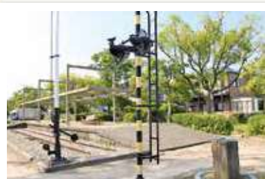
志免駅ホームと線路

公園入口には昭和60年の志免駅の写真や線路などがそのままの状態で見ることができ、当時志免町が炭坑で栄えた歴史がうかがえます。