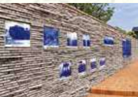
志免駅の歴史を彩った 当時の写真