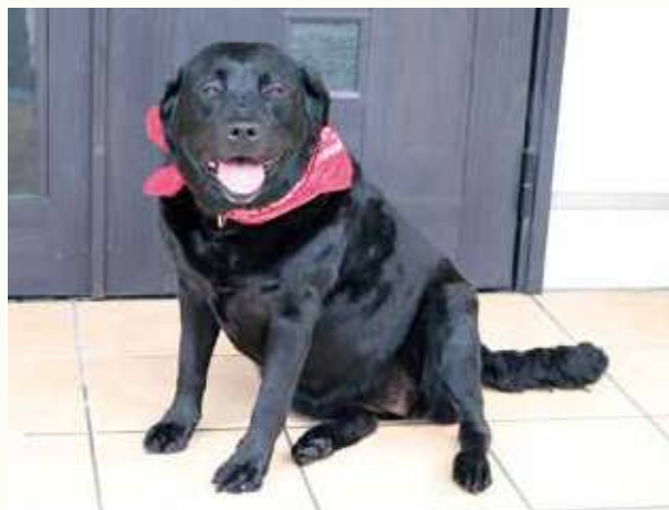
久山町山田 下原昌子さんの ラブラドル・レトリバー ラブちゃんメス(4)

パン、ケーキ、うどん、ラーメン、みそ、麦茶、ビール、焼酎などなど：私たちの周りにある食料、飲料の原料には、数多く「麦」が使われています。 麦は、用途に応じて小麦、大麦、はだか麦に分けられますが、福岡県は北海道に次ぐ麦の大生産地です。 チクゴイズミは、1994年に九州沖縄農業研究センターで生まれた品種です。タンパク質含有量が9.5%・10.5%程度（施肥量により異なる）で中力粉に分類される小麦です。 また、コムギの品種のひとつ、「関東107号」と「アサカゼコムギ」の交配により九州農業試験場が育成を行い、北九州地域など、温暖地以西の平坦地での栽培に向く品種として開発されました。製めん適性に優れ、農林認定品種となっています。旧系統名は西海171号。 国産小麦の主な用途は、日本麵（うどん、そうめん等）ですが、この中力粉は主に日本麵で使用されています。近年日本麵用として単独挽砕（他の品種と混ぜて製粉しないこと）が増加、うどん等で輸入麦にない独特のモチモチ感が出せる特長があり、九州以外での需要も拡大しています。 チクゴイズミの特徴 1. 早生で収量性に優れる。 2. 千粒重がやや大きく、穂発芽性が難で、枯れ熟れ様障害に強い。 3. 製粉特性は農林61号と同程度で、製めん適性はめんの食感にやや優れる。 4. たんばく質含量が14%と多く、コムギ縮萎縮病に強い。 5. 稈長はやや短く、穂長はやや長い。倒伏の発生は少ない。 6. 60%粉の粗蛋白質含量は高く、灰分含量はやや高い。小麦粉の明るさ、黄色みはほぼ同程度である。