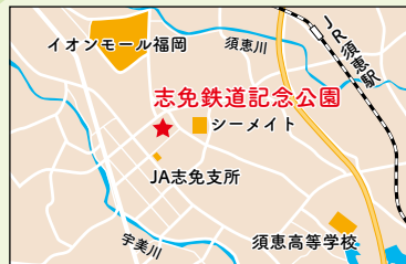
所在地 糟屋郡志免町志免中央2-7