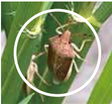
稲の株元に潜むイネカメムシ