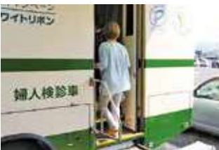
検診車へ乗り込む女性部員

女性部はがん検診を本所でを行い、乳腺エコー検査を46名、子宮がん検診を40名が受診しました。 乳がんは、日本人女性がかかる「がん」としては一番多く、超音波（エコー）を使った検査を勧めています。 また、子宮がんについては、頸がん0期の段階では、自覚症状がないことから検診による早期発見が決め手となります。 生活組織係は「多くの方に受診頂き、早期発見・早期治療で健康管理に役立てて欲しい」と話していました。