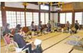
御詠歌練習の様子