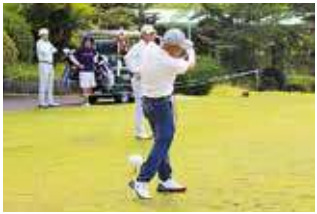
ゴルフを楽しむ年金友の会会員

年金友の会は、久山カントリ倶楽部で「JA倶楽部ゴルフコンペ」を開き、15組54名が参加し、会員相互の親睦を深めました。 参加者は「次回の開催も楽しみにしている」と話していました。