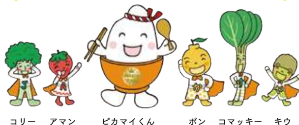
コリー アマン ピカマイくん ポン コマッキー キウ