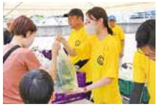
直売会にてスイートコーン販売を行う職員

地域ふれあい課は、今年4月に本所職員によって定植した約4,000本のスイートコーンの収穫を行いました。 収穫したスイートコーンはJA粕屋本所に隣接する旧なみの里で開催された農産物直売会で販売されました。 直売会では、管内で収穫されたスイートコーンを中心に地元生産者出荷の野菜の他、県産果樹、JA粕屋女性部による米粉シフォンケーキ、青年部による焼きトウモロコシ販売などの販売を行いました。 参加した職員は「管内農産物のPRと直接販売による生産者所得の向上につなげたい」と意気込み、大盛況となりました。 また、7日・11日までの1週間限定でスイートコーンの店頭販売を行いました。 購入者は、「昨年も購入したが、今年もスイートコーンの甘みを堪能したい」と笑顔で話していました。