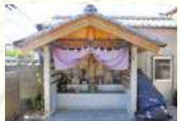
地蔵堂（74番薬師如来像安置）