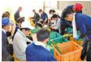
収穫を終え、販売に備えてコーンの調整を行う新入職員

令和7年度入組職員の農業体験として、地域ふれあい課が中心となって生産したスイートコーンの収穫体験を実施しました。 5月に行った水稻硬化作業に続いて今回2回目の体験となります。 農業経験の無い職員が増えている中、組合員の営農の大変さを肌で感じる目的で実施されました。 参加した職員は「初めてのスイートコーン収穫体験ということで要領を得ず、悪戦苦闘したが、最後は楽しんで作業が出来た。今後は農家の方に感謝しながら、食に対する認識を変えていきたい」と話していました。