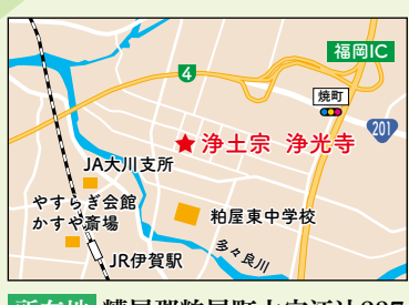
所在地 糟屋郡粕屋町大字江辻237