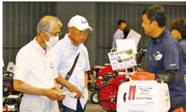
▲メーカー担当者の説明を受ける参加者