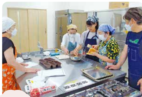
パン制作中の様子

女性部は、8月25日本所調理室にて「パン作り教室」を開きました。 講師の先生を招いてキャラクターのあんぱんとヒヨコのちぎりパンを作りました。 出来立てのパンは参加者全員で食しました。