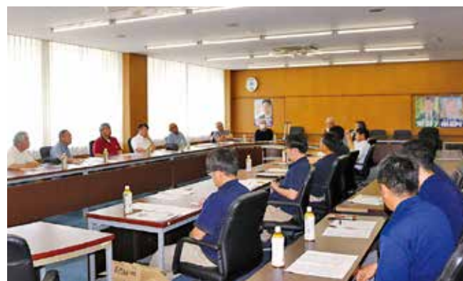
▲運営委員会の様子

今年のJA粕屋米販売方針を、「カントリーエレベーターの機能を生かし、JA粕屋米の品種別、収穫適期に応じた集荷に取り組みます。集荷対策として消費者より求められる良質で、安全・安心な米の生産に取り組み、直売米を中心とした販売拡大を通じて、地産地消の拡大と生産者所得向上を目指します」と掲げています。