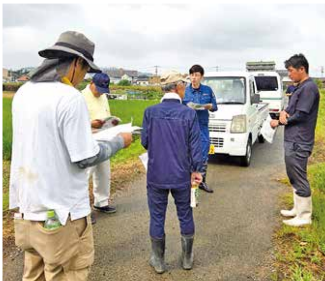
▲飼料用米について現地指導を行う指導員

指導会の中で北筑前普及センターより「飼料用米は収穫が大事であり、出穂期にイネカメムシの被害にあうと不稔粒が発生し、収量が低下を招くため、防除を徹底し、水管理の徹底を心がけて欲しい」と説明を行いました。管内27人にて31.2ヘクタールを耕作しており、10月下旬から11月上旬には収穫を迎える予定です。