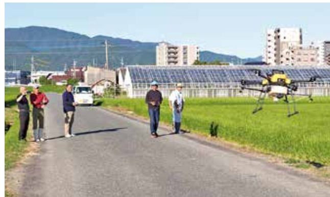
▲ドローンによる農薬散布の様子

今後は稲作を中心に、試験を行いながら、露地野菜、果樹へと拡大し、通年稼働を目指します。