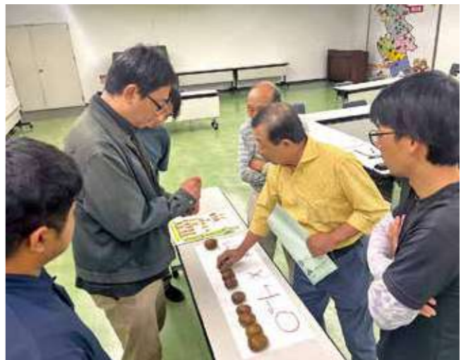
▲キウイフルーツ「甘うい目合わせ会」の様子

生産者からは「今年の出来は上々。甘みがしっかり乗っている」「この基準を徹底し、自信を持って市場に出したい」といった声が聞かれ、高品質な「甘うい」を届けるための意気込みが感じられました。