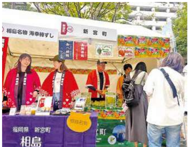
▲福岡県産みかんをPRする北部プラザ職員

立ち寄った買い物客は、色鮮やかなみかんを手に取り、販売開始直後から行列ができるほどの盛況ぶりでした。