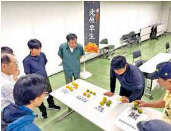
「北原早生」を手に取り、規格などを確認する生産者ら

J A粕屋の「北原早生」は、栽培面積2.5ヘクタール、生産量27トンを見込んでおり、10月末から本格的な出荷が開始されています。尚、11月中旬にかけてふくれんV Fやふるさと納税返礼品として出荷される予定です。今後も高品質な果実の安定供給に期待が寄せられています。