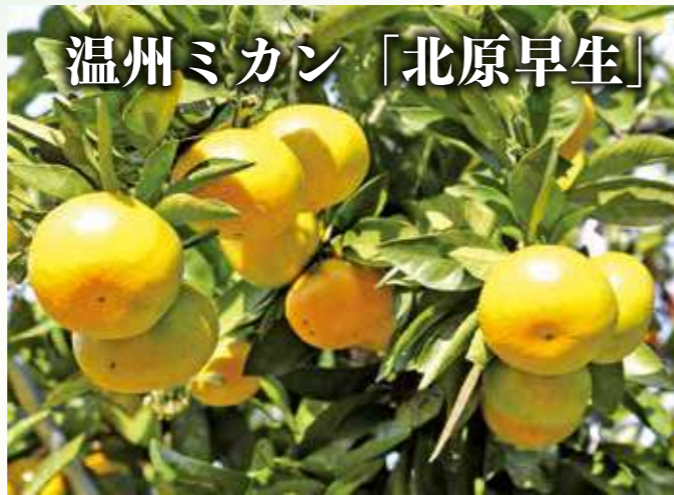
温州ミカン「北原早生」

J A粕屋の「北原早生」は、栽培面積2.5ヘクタール、生産量27トンを見込んでおり、10月末から本格的な出荷が開始されています。尚、11月中旬にかけてふくれんV Fやふるさと納税返礼品として出荷される予定です。今後も高品質な果実の安定供給に期待が寄せられています。