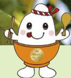
PR宣伝大使 JA粕屋マスコットキャラクター ピカマイくん