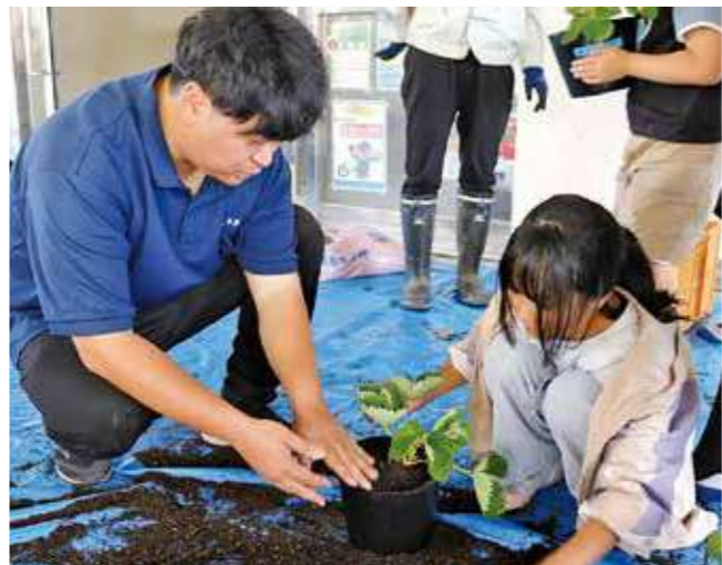
▲野菜苗の定植を体験する児童