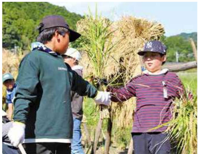
▲刈り取った稲を手渡す生徒

当日参加した生徒は「田植えから収穫までを体験してみて、農家の方の大変さを体験することができた。これからは農家の方に感謝しながらお米を食べたい」と話していました。