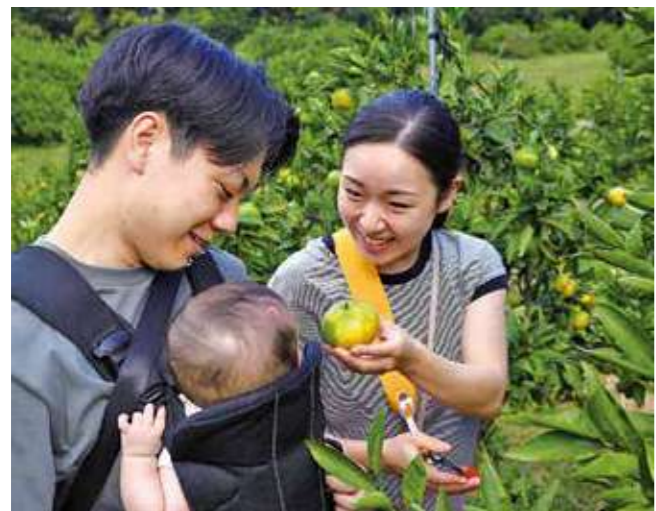
▲農園にてみかん狩りを楽しむ参加者

「みかん狩りを楽しませてもらい、農家の方の苦勞を肌で感じる良い機会となった」と話していました。