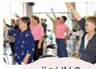
じゃんけんで皆さん大盛り上がり♪