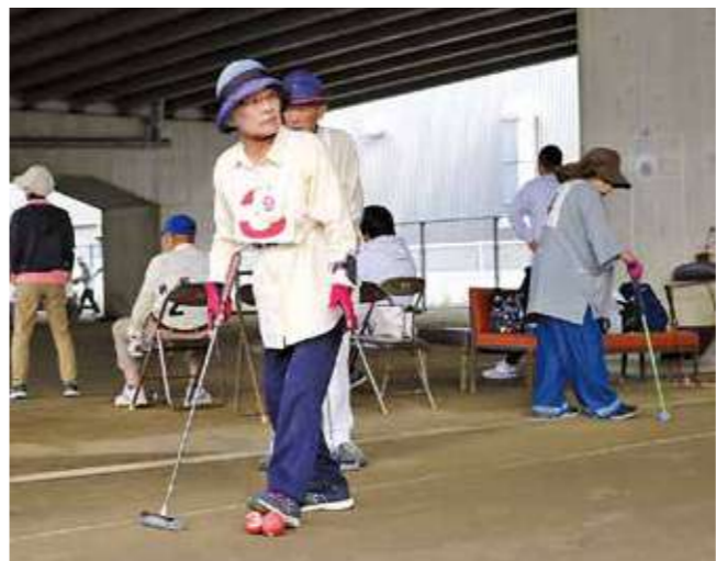
▲真剣な表情でゲートを見据える参加者

参加した年金友の会会員は、「楽しみにしていた大会に参加できて良かった。来年度に向けて、また練習に励みたい」と話していました。