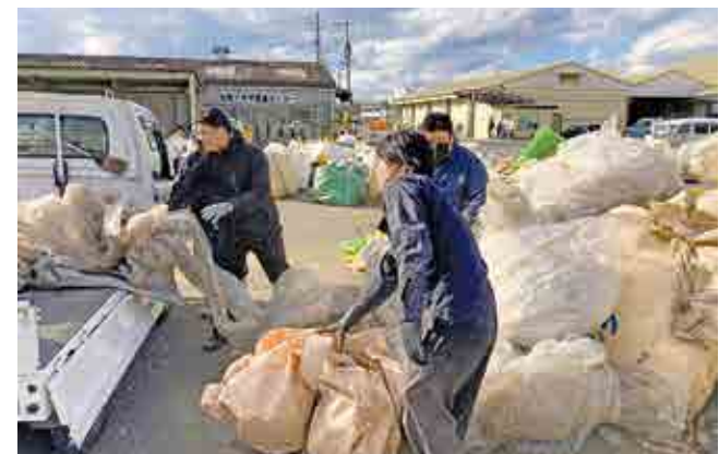
▲廃ビニールなどを回収するJA職員

北部プラザで農業用廃ビニール、マルチなどのポリ製品、肥料袋、育苗箱など18.1トン回収し、業者へ引き渡しました。JA粕屋では、環境汚染の防止や自然環境の保護に努めるため毎年回収を行っています。受付件数は161件で、廃ビニールを持ち込んだ農家は「環境問題が取り沙汰されている中、どこでも捨てられない物なので大変助かっている」と話していました。回収したビニール等は業者へ引き渡し、リサイクル等適切な処理を行っています。