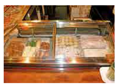
ショーケースに並んだ人気の焼き鳥