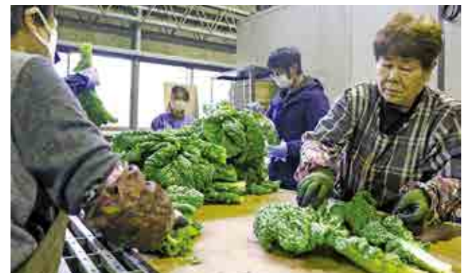
▲出荷前の調整作業

かつお菜は現在研究会員9人が58アールで栽培しており、「今年は9月の播種時の天候不順で苦勞した。白さび病の予防を十分行った。」と話しており、苦勞して育てたかつお菜を丁寧に収穫していました。