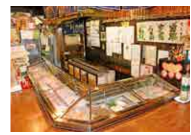
カウンター席景観