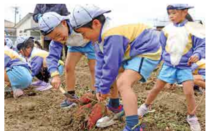
▲協力してさつまいもを収穫する園児

参加した園児は「土を掘ったり、土の中から芋を探し出すのが大変だったけど、みんなでたくさんの芋ほりが出来て楽しかった」と話していました。