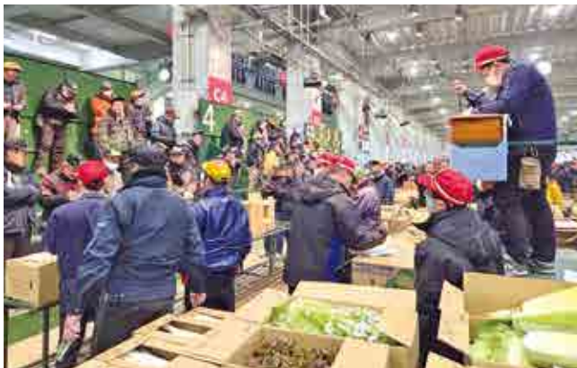
▲活気に溢れる初競りの様子

福岡大同青果にて新年恒例の「初競り」が行われました。早朝の冷え込みの中、威勢の良い掛け声とともに始まった競り場で、ひときわ注目を集めたのが自慢のブロッコリーです。年末年始の寒波を乗り越え、ぎゅっと身が締まったブロッコリーは、生産者による出荷前の目合わせ会を毎日行っているため、市場関係者から高い評価を受けています。生産者は「皆さんに元気を届けられるよう愛情を込めて育てた。冬の寒さで美味しくなったブロッコリーの甘みを是非味わってほしい」と話していました。