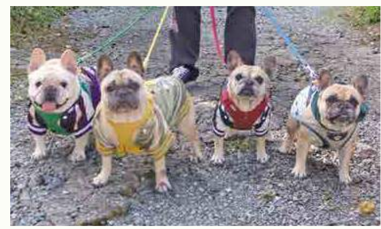
古賀市青柳 森 裕俊