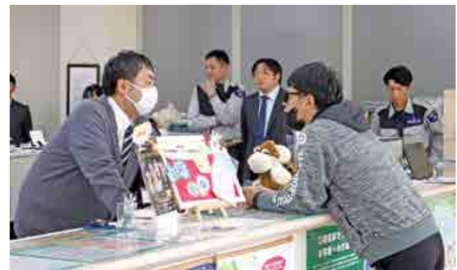
▲怒声を上げる不審者に対し冷静な声掛けを行う宇美支所熊本支所長

参加職員は「本番さながらの演技で、非常に有意義な訓練となった。改めて防犯意識を高めたい」と話していました。