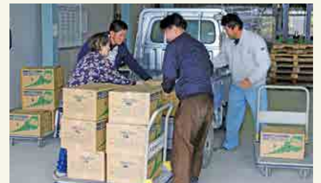
朝採れのブロッコリーを集荷場へ運び込む生産者