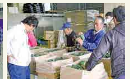
目合わせ会の様子