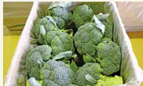
出荷前のブロッコリー